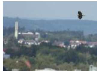
Bild 4: Wespenbussard