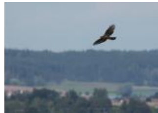
Bild 2: Wespenbussard