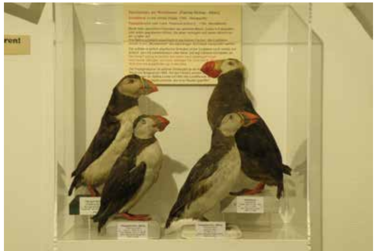
Abb. 4: Links: Papageitaucher Fratercula arctica . ZSRO Av 2392, ad., ♂, 3jährig, Wahrscheinlich Island, leg. Friedrich Faber? Gezeichnet Friedrich Sturm 1830, „ad nat. pinxit & sculpsit“, Nürnberg, gedruckt 1834 in Deutschlands Fauna in Abb. nach der Natur mit Beschreibungen. Hrsg. Jacob Sturm. Rechts: Papageitaucher Fratercula arctica . ZSRO Av 2391 immat., 1jährig. Ohne Ort. Vorlage für die Nebenzeichnung fig. 2 von Fr. Sturm (s. o.). Präparat Nr. Ca621 = Coll. Herzog Paul Wilhelm von Württemberg. – Left: Puffin Fratercula arctica . ZSRO Av 2392, ad., ♂, 3rd year, probably from Island, leg. Friedrich Faber? Drawing by Friedrich Sturm 1830, „ad nat. pinxit & sculpsit“, Nuremberg, printed 1834 in „Deutschlands Fauna in Abb. nach der Natur mit Beschreibungen“, Editor Jacob Sturm. Right: Puffin Fratercula arctica . ZSRO Av 2391 immat., 1st year. No locality. Model for the drawing fig. 2 by Fr. Sturm (see above). Specimen no. Ca621 = Collection of Duke Paul Wilhelm von Wuerttemberg.