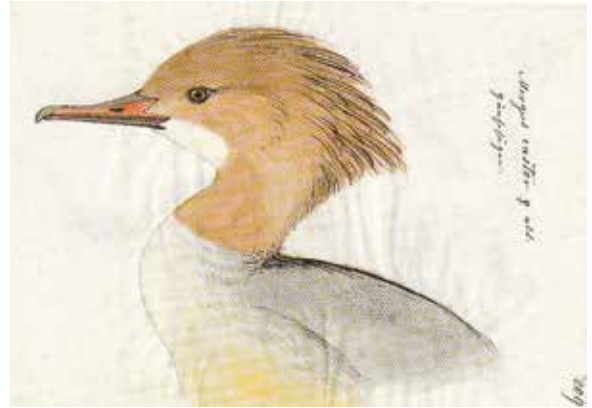
Abb. 5: Gänsesäger Mergus merganser . ZSRO Av 2519, ♂ ad. Präparat und Abbildung von Johann Friedrich Leu aus seinem handschriftlichen Vogelbuch mit Zeichnungen (Pfeuffer 2003). – Goosander Mergus merganser . ZSRO Av 2519, ♀ ad. Model and drawing by Johann Friedrich Leu from his hand-written bird book with drawings (Pfeuffer 2003).